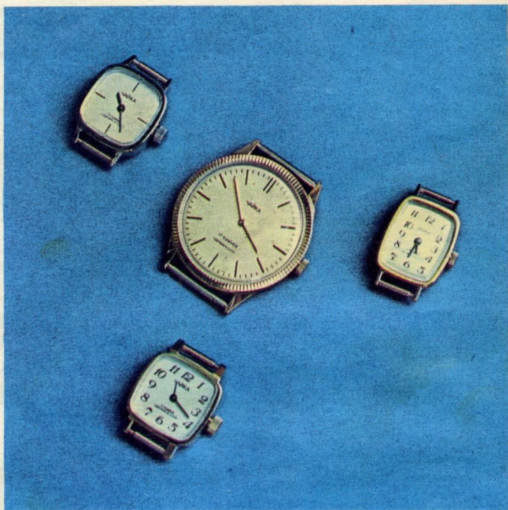
Часы женские механические «Чайка» на 17 рубиновых камнях. Цена — 34 руб.