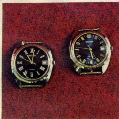
Часы мужские механические «Восток». Имеют календарь. Цена — 33 р. 50 к.