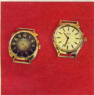
Часы мужские механические «Луч» на 23 рубиновых камнях. Цена — 46 р. 50 к.