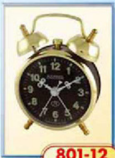
801-12 диаметр 75 мм