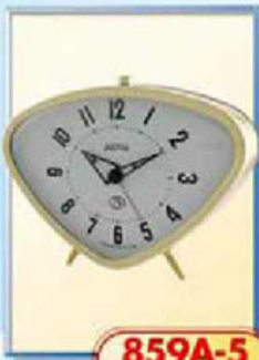
859A-5 размер 150x105 мм