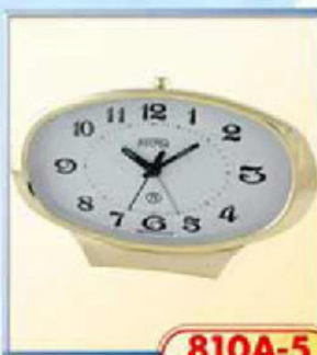
810A-5 размер 190x95 мм