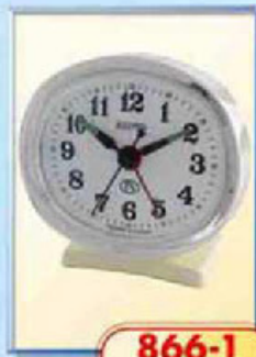
866-1 размер 90x80 мм