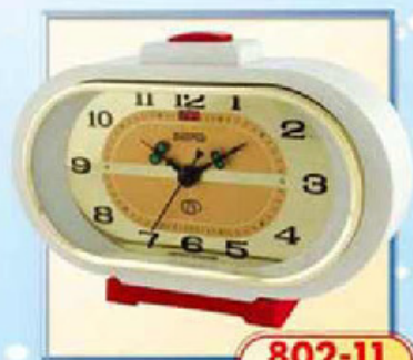
802-11 размер 165x90 мм