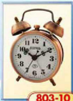
803-10 диаметр 75 мм