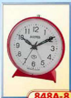
848A-8 диаметр 100 мм