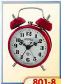
801-8 диаметр 75 мм