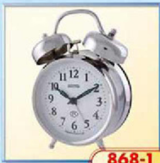
868-1 диаметр 112 мм