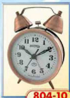
804-10 диаметр 88 мм