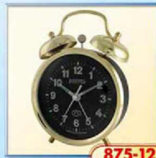
875-12 диаметр 112 мм