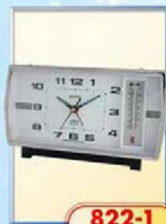
822-1 размер 180x95 мм