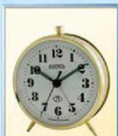
819A-5 диаметр 100 мм