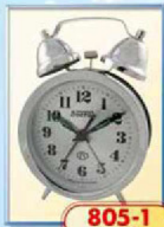
805-1 диаметр 88 мм