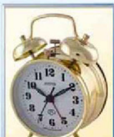
872-5 диаметр 88 мм