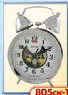
805ск-1 диаметр 88 мм