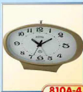
810A-4 размер 190x95 мм