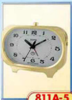
811A-5 размер 140x85 мм