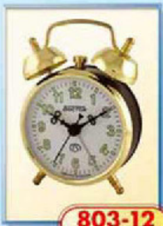
803-12 диаметр 75 мм