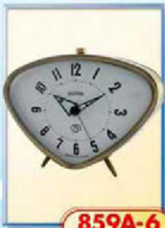
859A-6 размер 150x105 мм