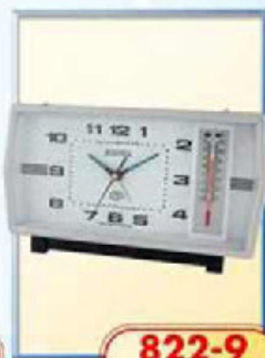
822-9 размер 180x95 мм