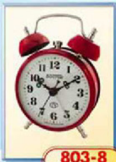
803-8 диаметр 75 мм