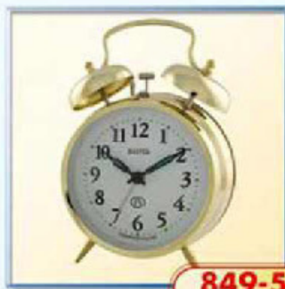
849-5 диаметр 112 мм