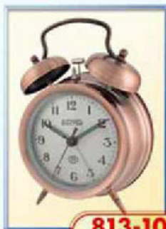
813-10 диаметр 100 мм