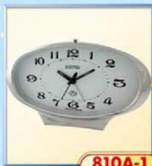
810A-1 размер 190x95 мм