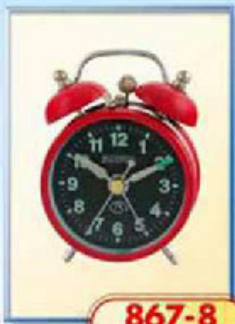
867-8 диаметр 70 мм