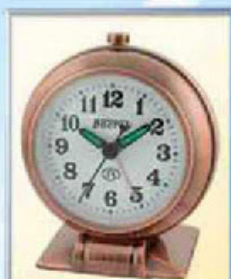
871A-10 диаметр 88 мм