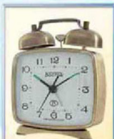
824-6 размер 100x85 мм