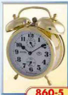
860-5 диаметр 88 мм