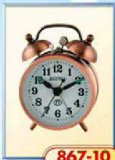
867-10 диаметр 70 мм