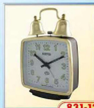
831-12 размер 110x105 мм