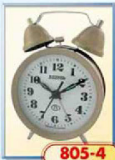
805-4 диаметр 88 мм