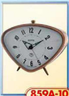
859A-10 размер 150x105 мм