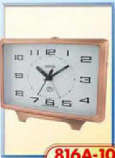
816A-10 размер 150x100 мм