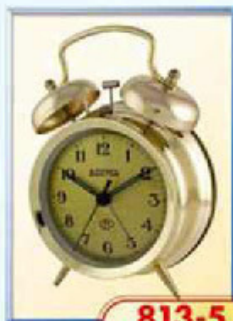
813-5 диаметр 100 мм