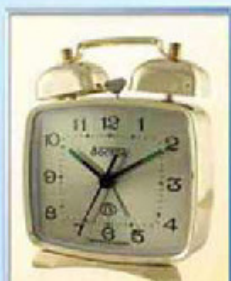
824-5 размер 100x85 мм