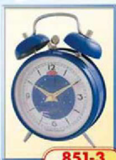
851-3 диаметр 100 мм