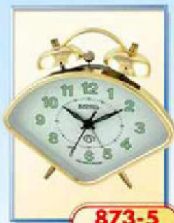
873-5 размер 150x105 мм