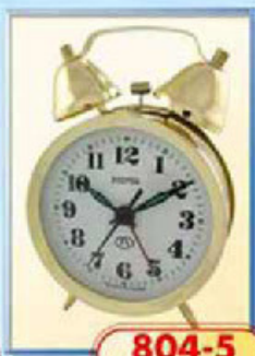
804-5 диаметр 88 мм