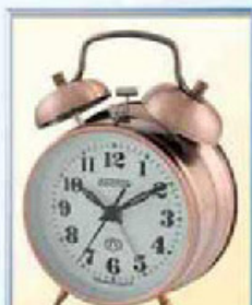
872-10 диаметр 88 мм