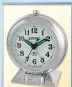
871A-1 диаметр 88 мм