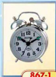
867-1 диаметр 70 мм