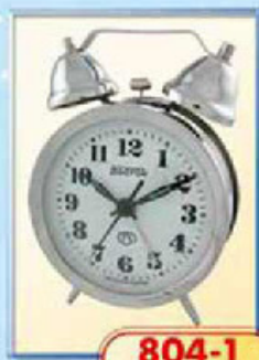
804-1 диаметр 88 мм