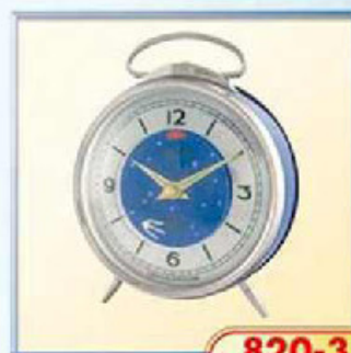
820-3 диаметр 100 мм