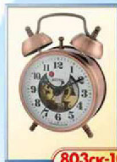
803ск-10 диаметр 75 мм