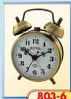
803-6 диаметр 75 мм