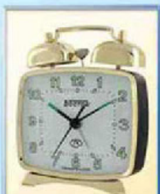
824-12 размер 100x85 мм