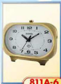
811A-6 размер 140x85 мм