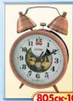
805ск-10 диаметр 88 мм