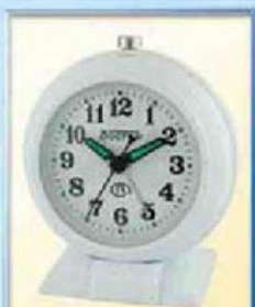
871A-11 диаметр 88 мм