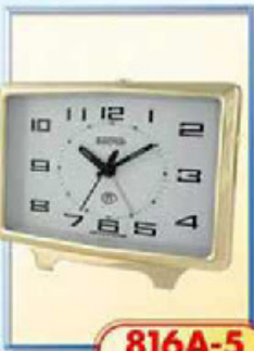
816A-5 размер 150x100 мм