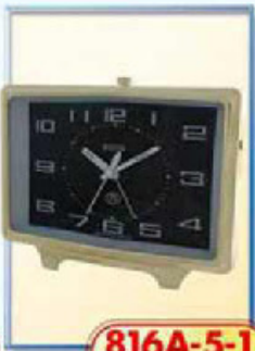
816A-5-1 размер 150x100 мм