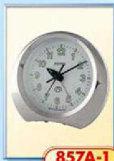
857A-1 размер 125x110 мм