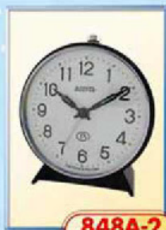
848A-2 диаметр 100 мм