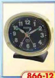
866-12 размер 90x80 мм