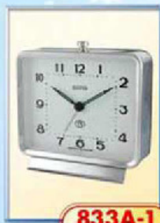
833A-1 диаметр 125 мм