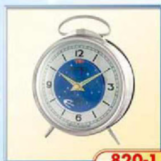
820-1 диаметр 100 мм