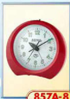
857A-8 размер 125x110 мм