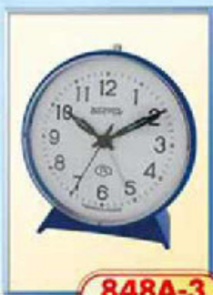
848A-3 диаметр 100 мм