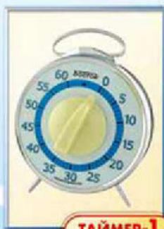
ТАЙМЕР-1 диаметр 100 мм