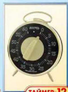
ТАЙМЕР-12 диаметр 100 мм