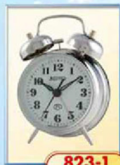
823-1 диаметр 75 мм