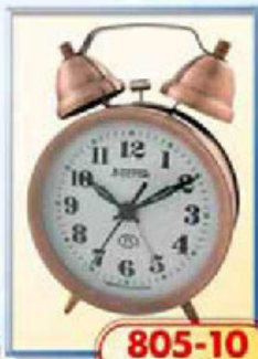
805-10 диаметр 88 мм