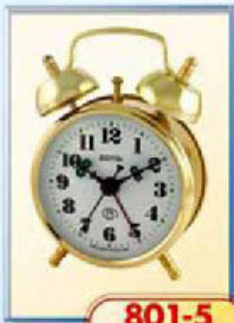
801-5 диаметр 75 мм