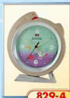
829-4 диаметр 125 мм