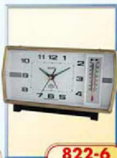
822-6 размер 180x95 мм