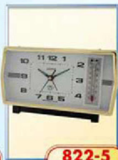
822-5 размер 180x95 мм