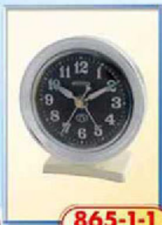
865-1-1 диаметр 75 мм