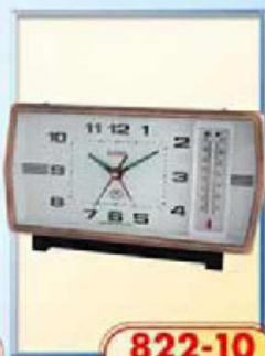
822-10 размер 180x95 мм