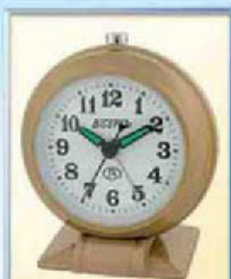
871A-4 диаметр 88 мм