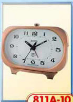
811A-10 размер 140x85 мм