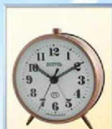
819A-10 диаметр 100 мм