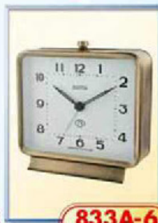
833A-6 диаметр 125 мм