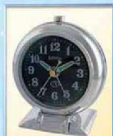
871A-1-1 диаметр 88 мм