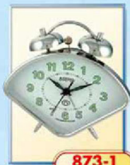
873-1 размер 150x105 мм