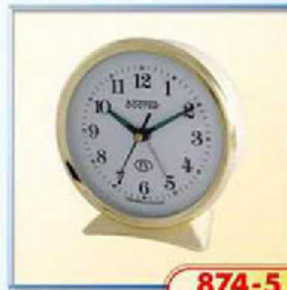
874-5 диаметр 112 мм