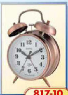
817-10 диаметр 100 мм