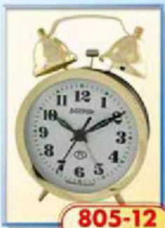
805-12 диаметр 88 мм