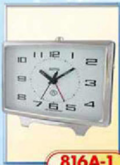
816A-1 размер 150x100 мм