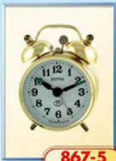
867-5 диаметр 70 мм