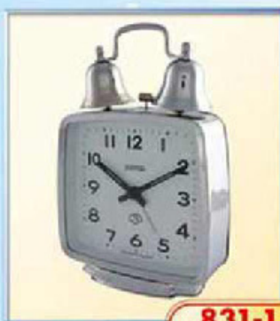
831-1 размер 110x105 мм