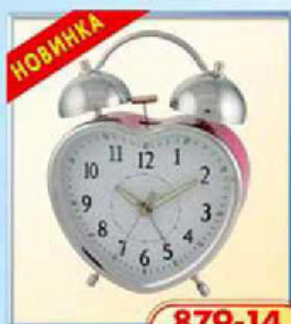
879-14 размер 128x110 мм