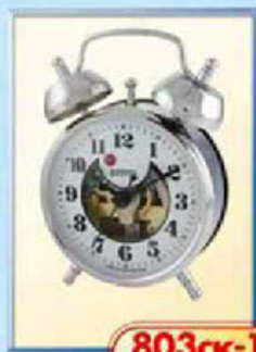
803ск-1 диаметр 75 мм