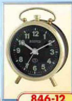
846-12 диаметр 88 мм