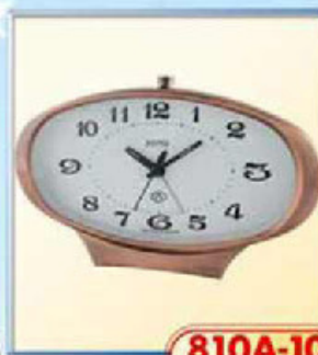
810A-10 размер 190x95 мм