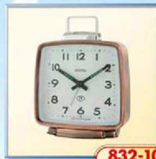
832-10 размер 110x105 мм