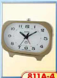
811A-4 размер 140x85 мм