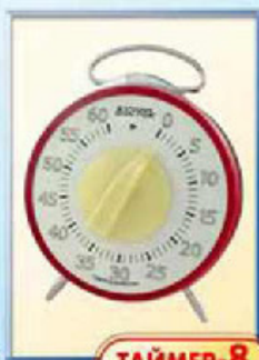
ТАЙМЕР-8 диаметр 100 мм