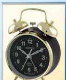
872-12 диаметр 88 мм