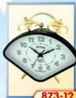
873-12 размер 150x105 мм