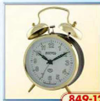
849-12 диаметр 112 мм