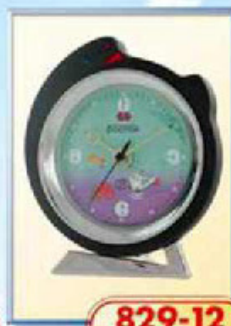
829-12 диаметр 125 мм