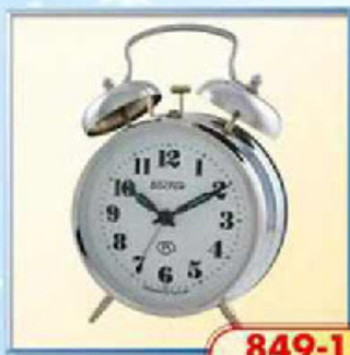
849-1 диаметр 112 мм