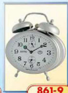
861-9 размер 115x85 мм