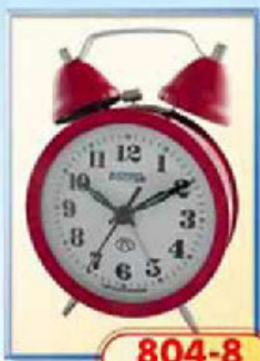
804-8 диаметр 88 мм