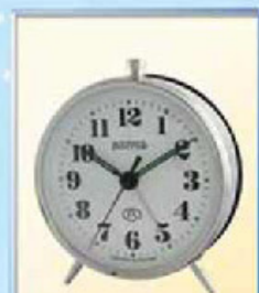
819A-1 диаметр 100 мм