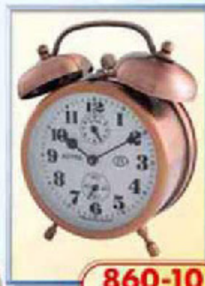
860-10 диаметр 88 мм