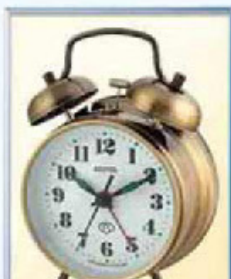
872-6 диаметр 88 мм