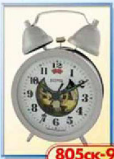
805ск-9 диаметр 88 мм