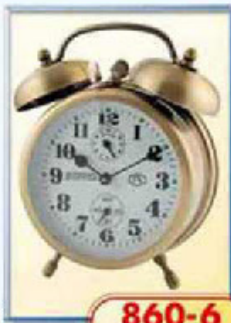
860-6 диаметр 88 мм