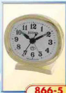
866-5 размер 90x80 мм