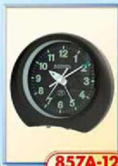
857A-12 размер 125x110 мм