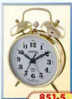
851-5 диаметр 100 мм