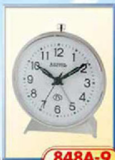
848A-9 диаметр 100 мм