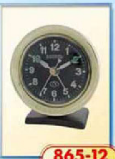
865-12 диаметр 75 мм