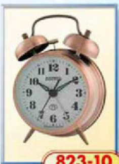
823-10 диаметр 75 мм