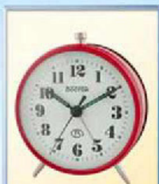
819A-8 диаметр 100 мм