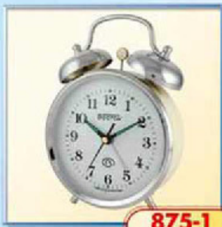
875-1 диаметр 112 мм