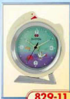
829-11 диаметр 125 мм