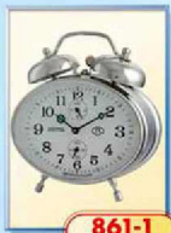
861-1 размер 115x85 мм