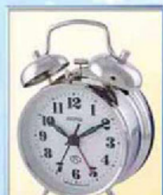
872-1 диаметр 88 мм