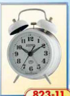
823-11 диаметр 75 мм