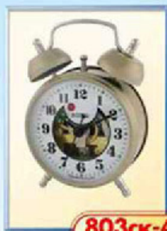
803ск-4 диаметр 75 мм