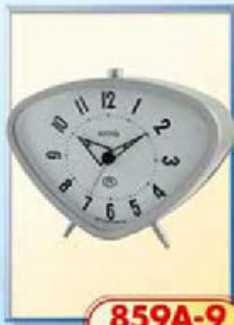
859A-9 размер 150x105 мм