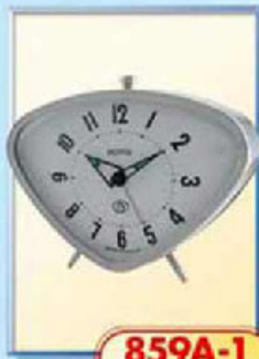
859A-1 размер 150x105 мм