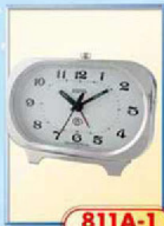
811A-1 размер 140x85 мм