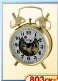
803ск-5 диаметр 75 мм