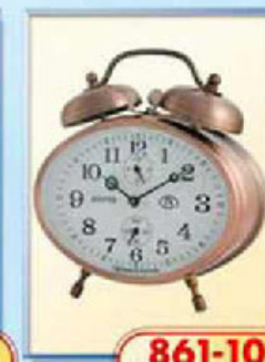
861-10 размер 115x85 мм