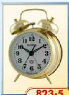
823-5 диаметр 75 мм