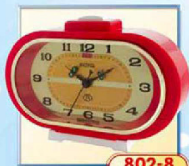
802-8 размер 165x90 мм