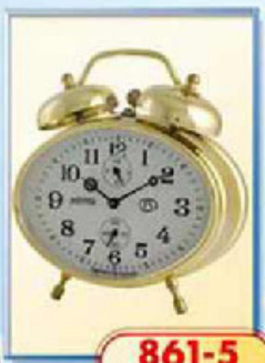
861-5 размер 115x85 мм