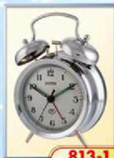
813-1 диаметр 100 мм