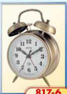
817-6 диаметр 100 мм