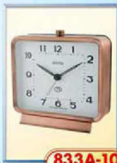
833A-10 диаметр 125 мм