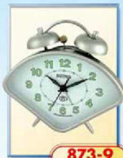
873-9 размер 150x105 мм