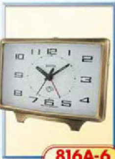
816A-6 размер 150x100 мм