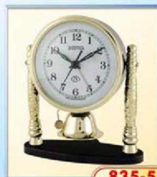
835-5 диаметр 100 мм