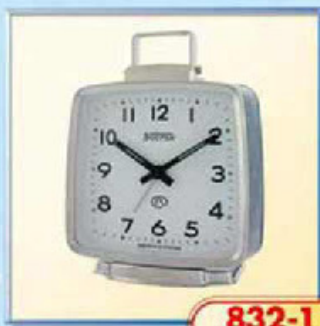
832-1 размер 110x105 мм