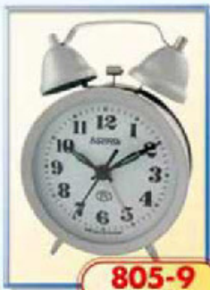
805-9 диаметр 88 мм