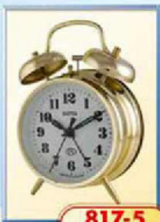
817-5 диаметр 100 мм