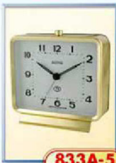
833A-5 диаметр 125 мм