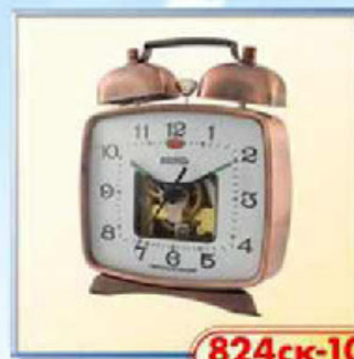
824ck-10 100x85 мм