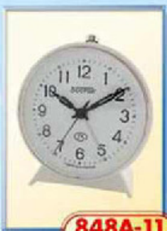
848A-11 диаметр 100 мм