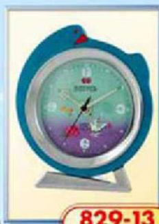
829-13 диаметр 125 мм