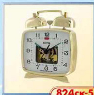
824ck-5 100x85 мм