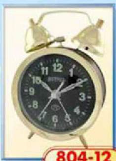
804-12 диаметр 88 мм