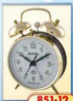
851-12 диаметр 100 мм