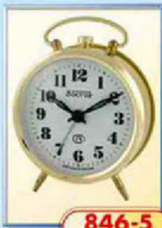
846-5 диаметр 88 мм