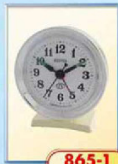
865-1 диаметр 75 мм