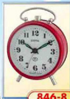
846-8 диаметр 88 мм