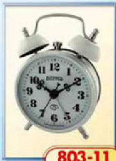
803-11 диаметр 75 мм