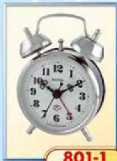
801-1 диаметр 75 мм