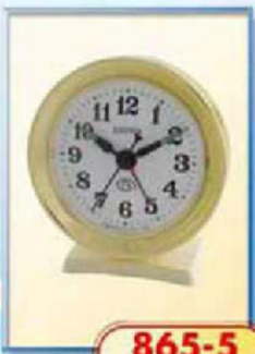
865-5 диаметр 75 мм