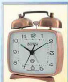
824-10 размер 100x85 мм