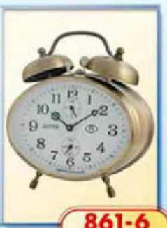
861-6 размер 115x85 мм