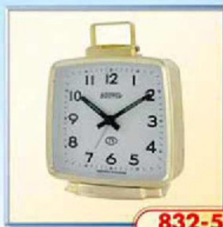
832-5 размер 110x105 мм