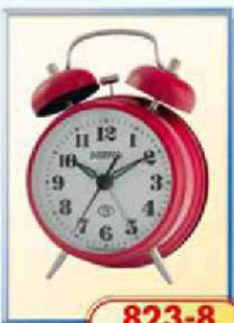
823-8 диаметр 75 мм