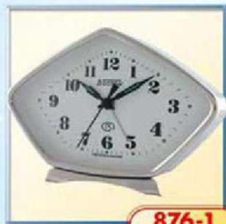
876-1 размер 160x100 мм