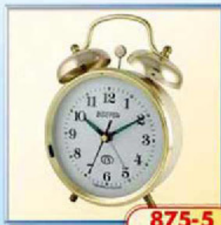
875-5 диаметр 112 мм