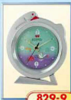
829-9 диаметр 125 мм