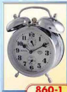
860-1 диаметр 88 мм