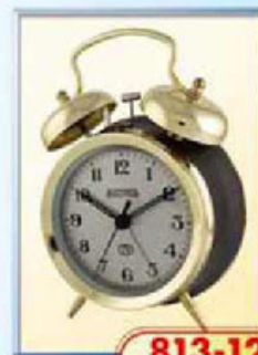
813-12 диаметр 100 мм