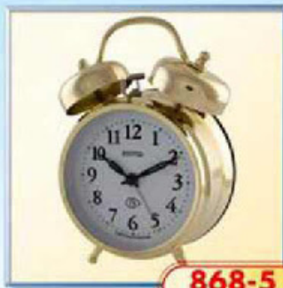
868-5 диаметр 112 мм