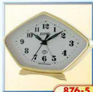
876-5 размер 160x100 мм