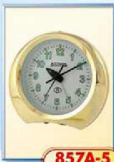
857A-5 размер 125x110 мм