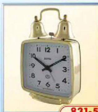
831-5 размер 110x105 мм