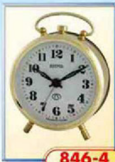
846-4 диаметр 88 мм