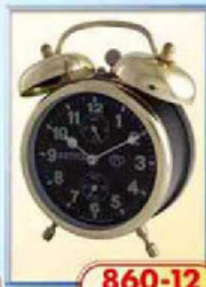
860-12 диаметр 88 мм