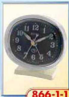
866-1-1 размер 90x80 мм