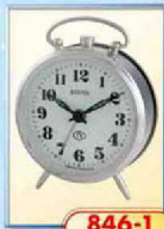
846-1 диаметр 88 мм