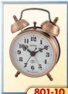
801-10 диаметр 75 мм