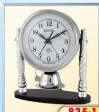
835-1 диаметр 100 мм