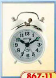
867-11 диаметр 70 мм