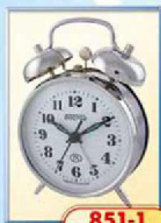
851-1 диаметр 100 мм