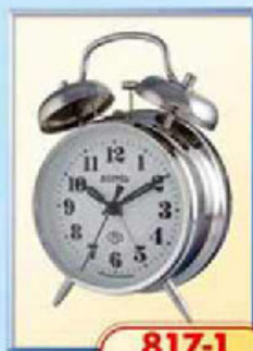
817-1 диаметр 100 мм