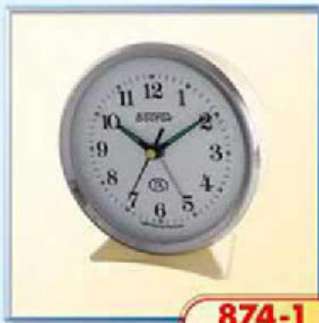
874-1 диаметр 112 мм