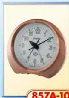
857A-10 размер 125x110 мм