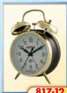
817-12 диаметр 100 мм