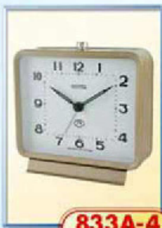
833A-4 диаметр 125 мм