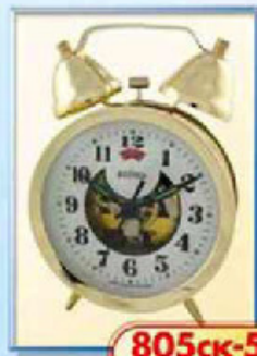
805ск-5 диаметр 88 мм