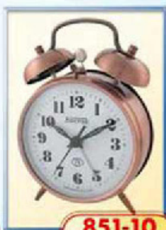
851-10 диаметр 100 мм