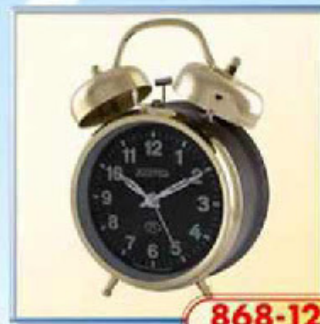
868-12 диаметр 112 мм