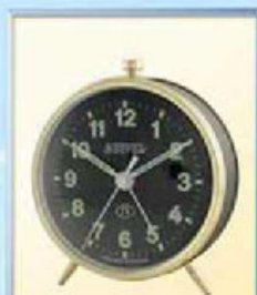
819A-12 диаметр 100 мм