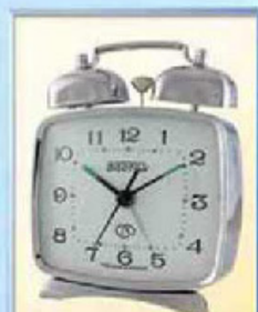
824-1 размер 100x85 мм