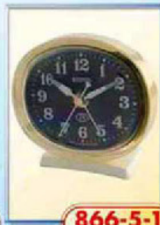
866-5-1 размер 90x80 мм